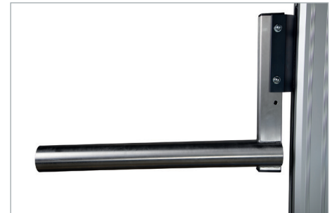
Optional: Anbauteil Dorn