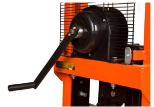
Winde mit Lastdruckbremse