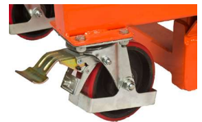
Lenkräder mit Bremsfunktion