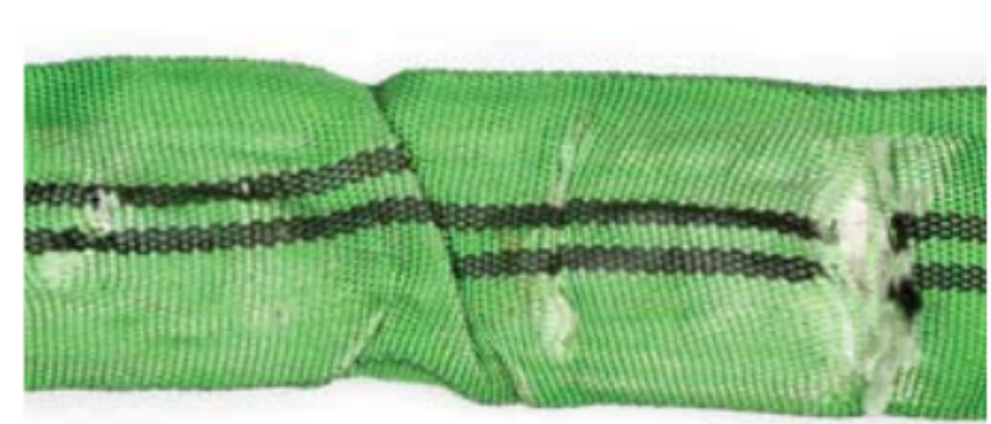
Beschädigung der Hülle durch Abrieb oder Schnitte - bei sichtbarem Kern muss die Rundschlinge sofort außer Betrieb genommen werden!