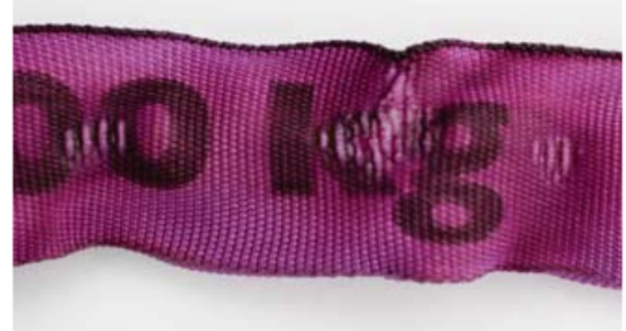
Glänzende Oberfläche und/oder Verhärtung des Gewebes durch Hitze