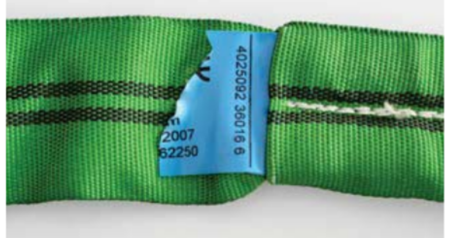
Etikett muss vollständig vorhanden und gut lesbar sein