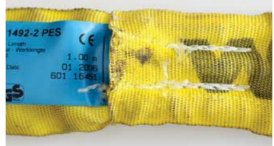
Nahtbrüche der Ummantelung