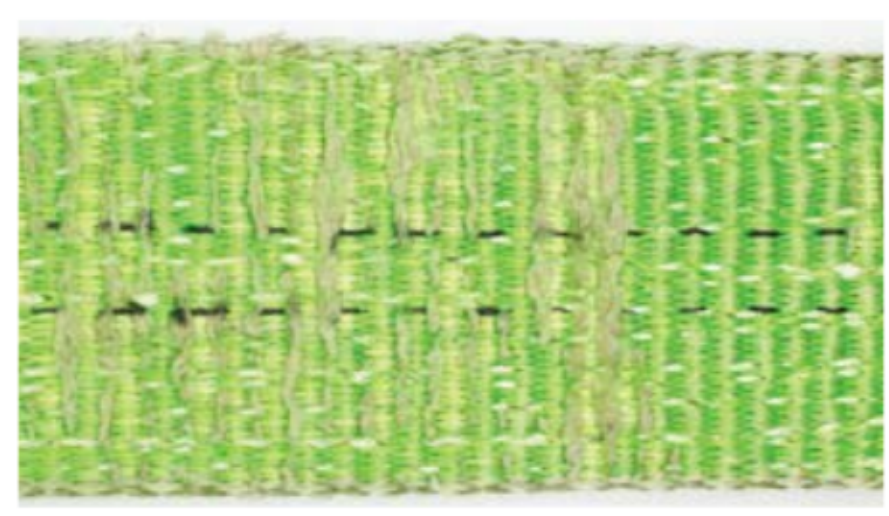
Beschädigungen des Gewebes durch Abrieb oder Schnitte