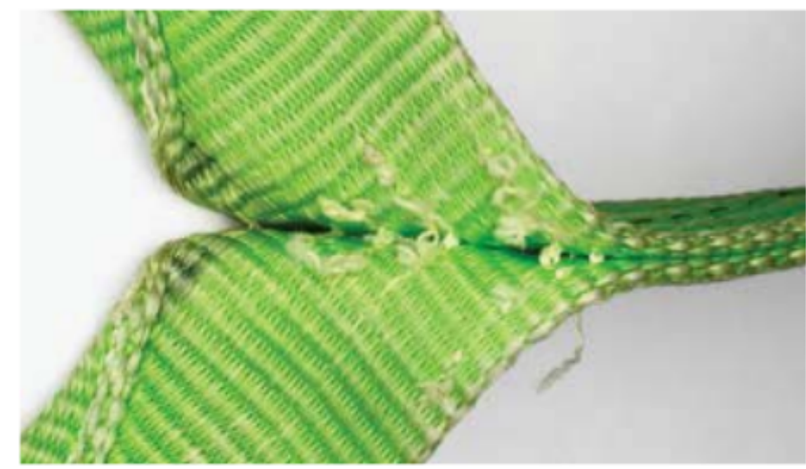
Beschädigung von tragenden Nähten.