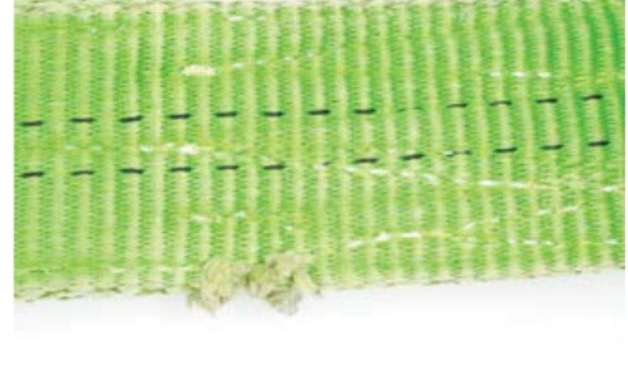
Jegliche Beschädigung der Webkante