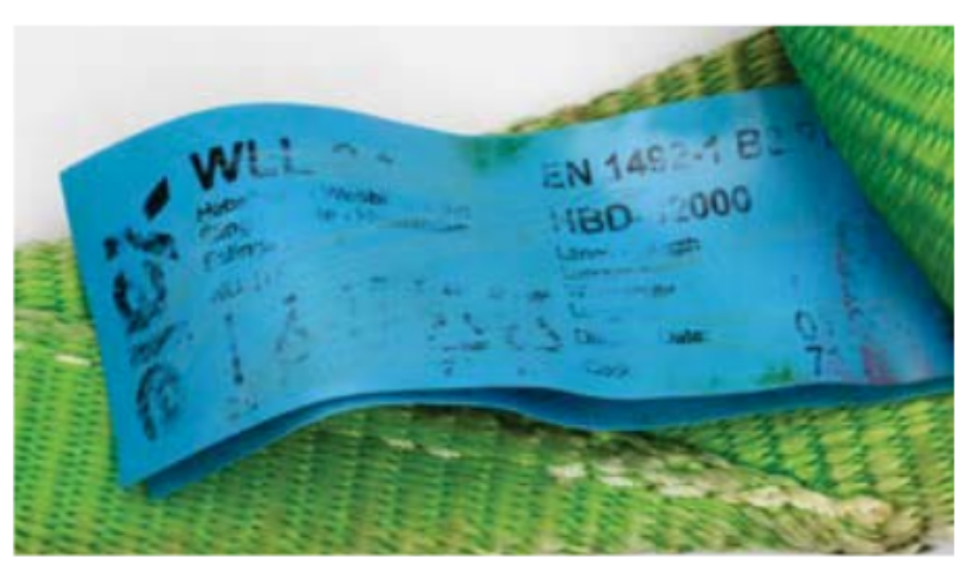
Etikett muss vollständig vorhanden und gut lesbar sein