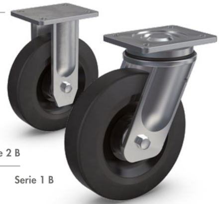
Serie 2 B