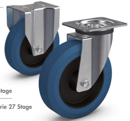
Serie 28 Stage