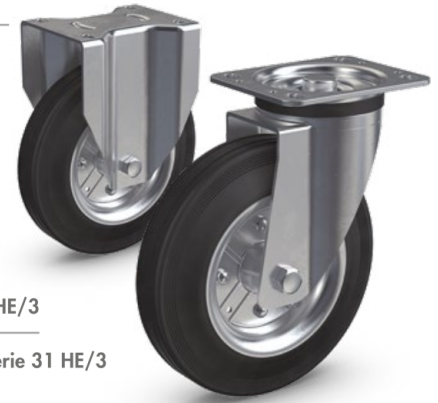
Serie 32 HE/3