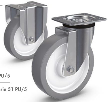
Serie 52 PU/5