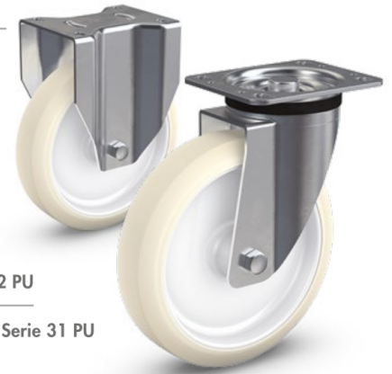
Serie 32 PU