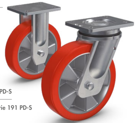
Serie 192 PD-S