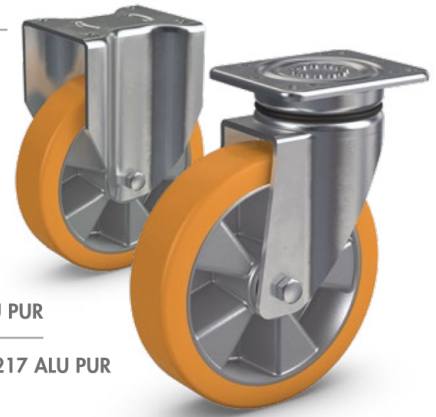
Serie 218 ALU PUR