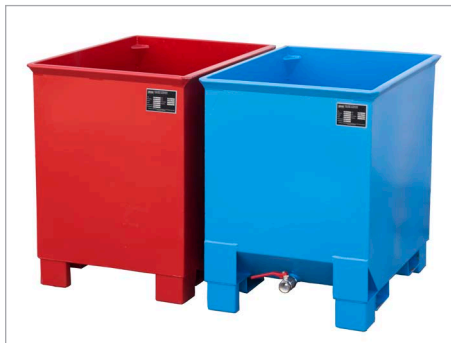
C 30 und CS 30