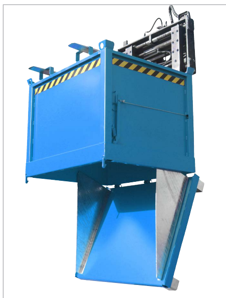
FB mit Zentrierwänden