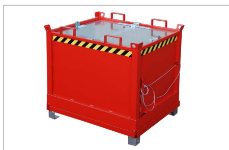
FB mit Deckel