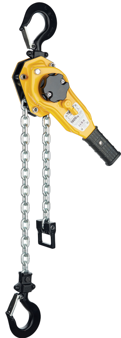
Yale PT-B TRAGFÄHIGKEITEN 800 – 6.300 KG

Die Überlastsicherung dient dazu alle Bauteile am und im Gerät vor einer unzulässigen Überlastung zu schützen. Sie reagiert in der Regel bei einer Überschreitung der zulässigen Tragfähigkeit um 25 %. Geräte mit Überlastsicherung sind zur Identifizierung mit einem schwarzem Handrad ausgestattet.