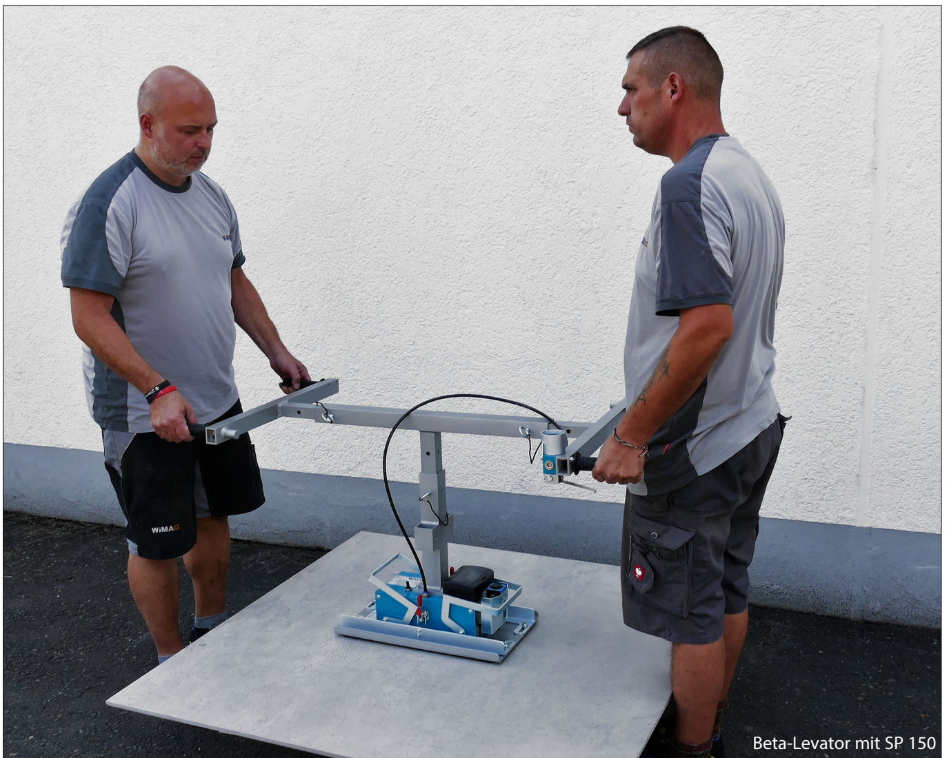
Beta-Levator mit SP 150