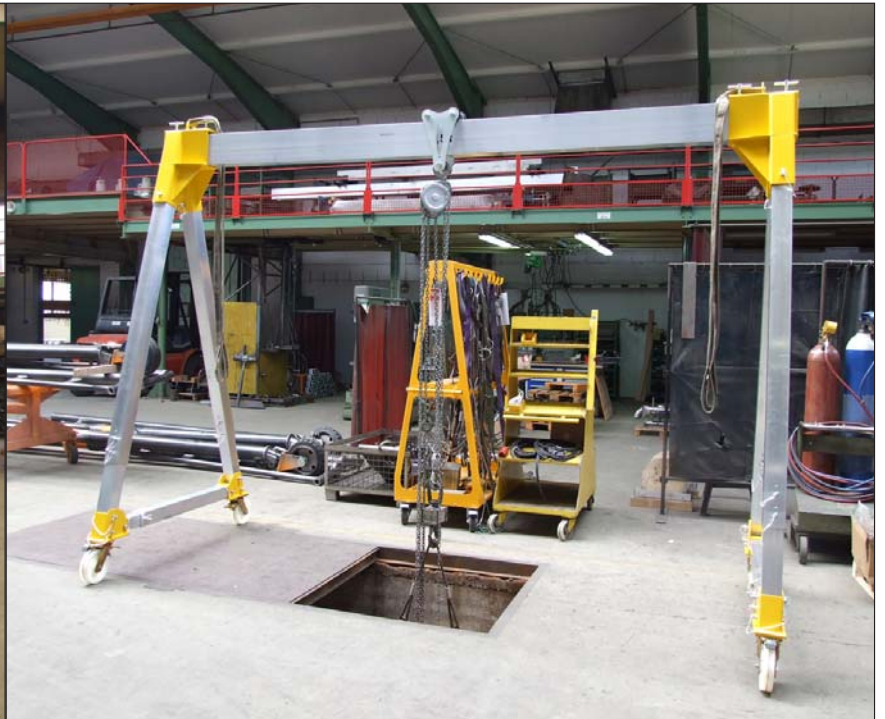
535 510: 1,5 t Trägerlänge 4 m Höhe verstellbar 2,9 / 4,0 m