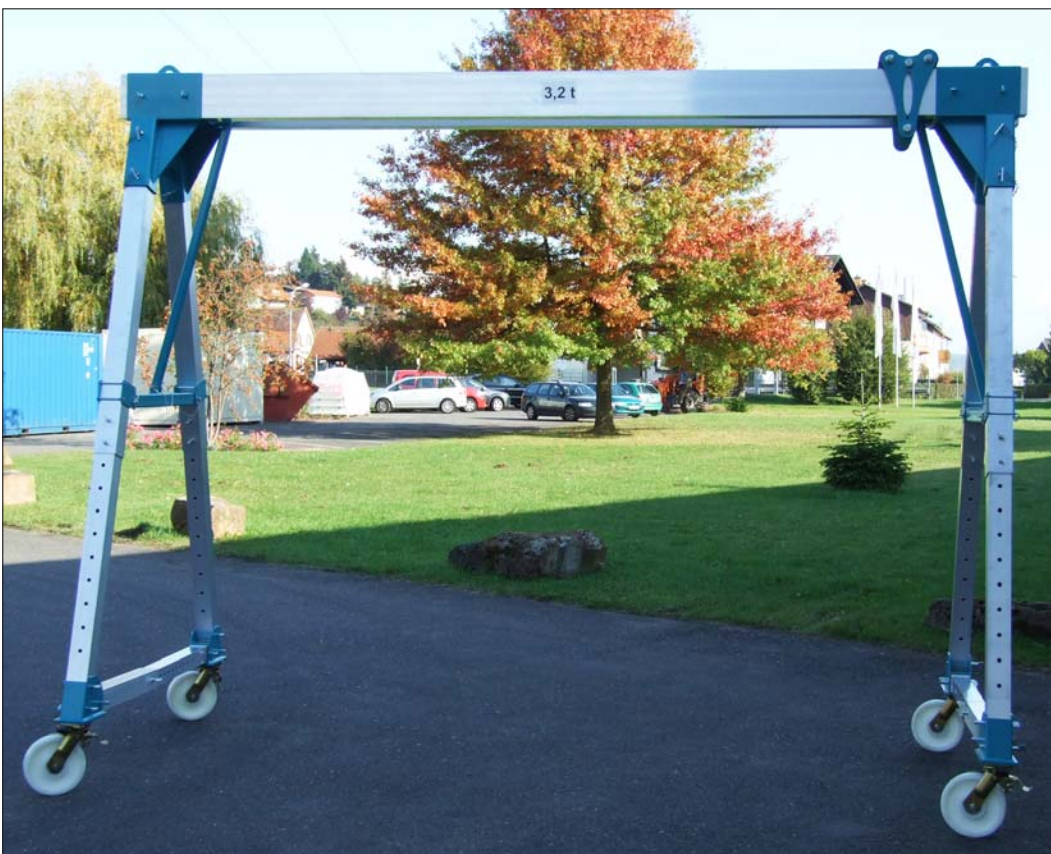
535 200: 3,2 t Ausführung mit Doppelträger Trägerlänge 4 m Höhe verstellbar 2,4 / 3,2 m