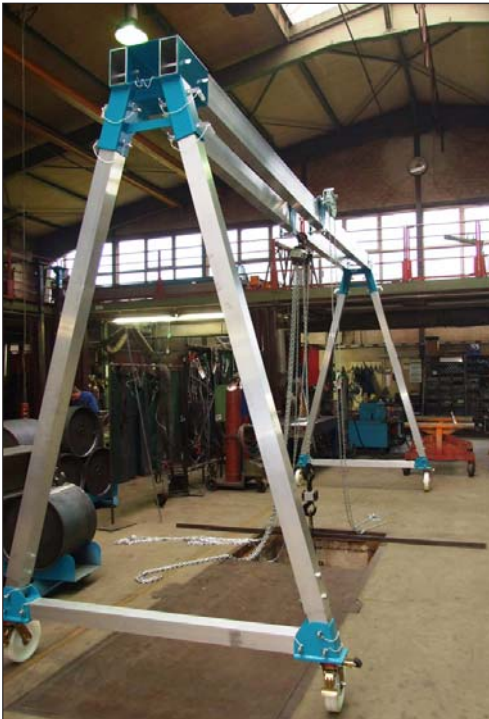
535 505: 1,5 t Trägerlänge 6 m Ausführung mit Doppelträger, Höhe starr 3,5 m Laufkatze mit Haspelfahrwerk