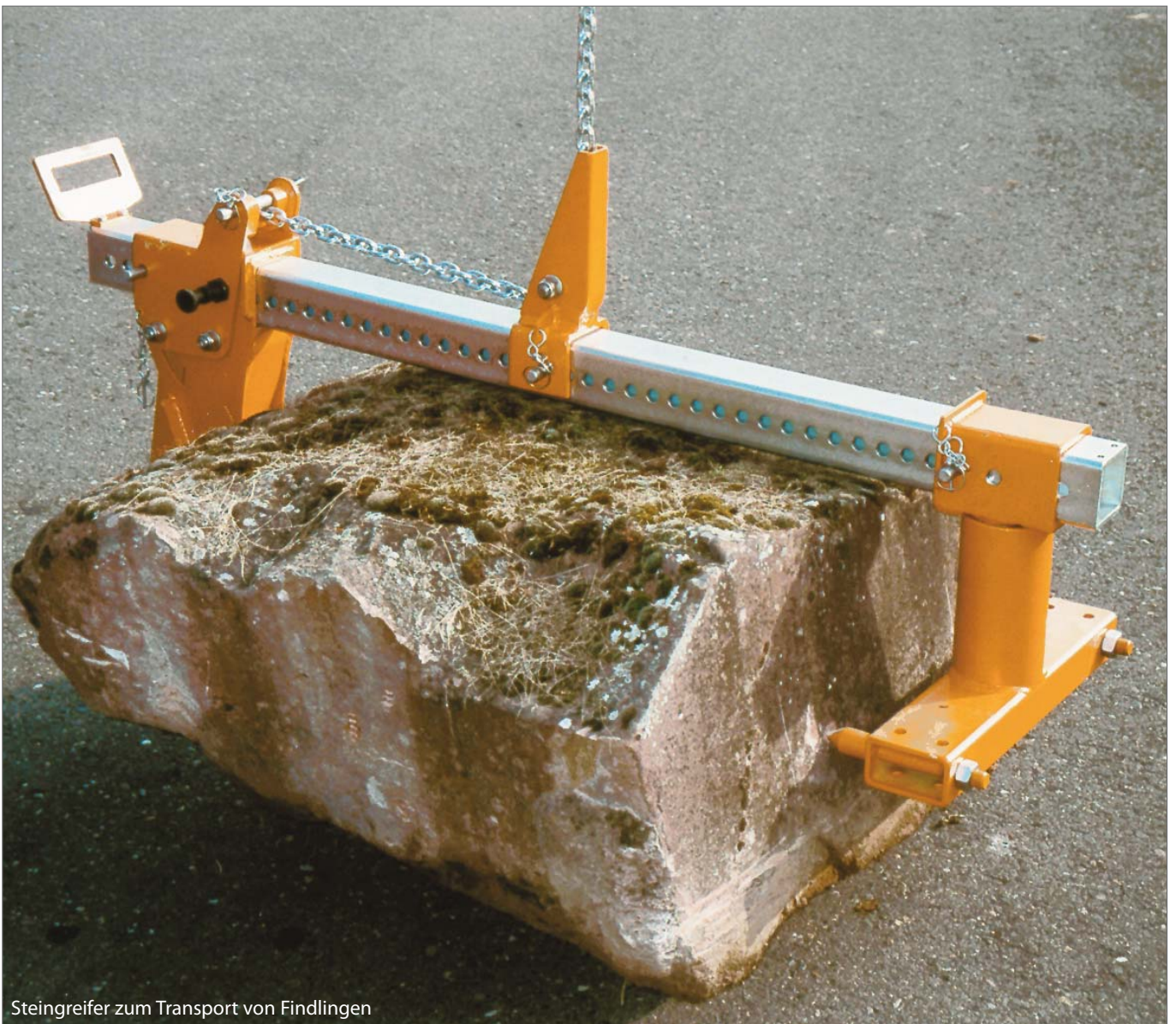
Steingreifer zum Transport von Findlingen