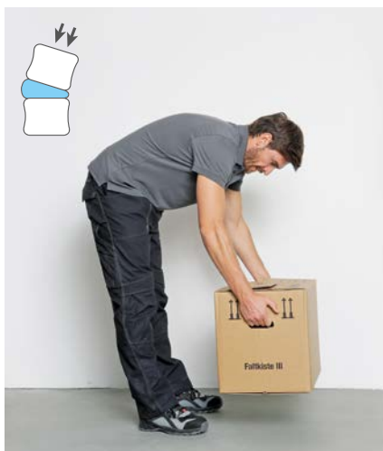
Falsch: Bücken und heben belastet den Rücken