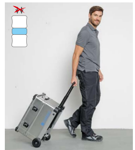
Optimal: Ziehen statt tragen (mit ZARGES)