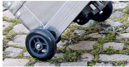
Die praktischen, aufsteckbaren Rollen laufen auch auf längeren Distanzen leicht. Rollen Set Ø 125 mm