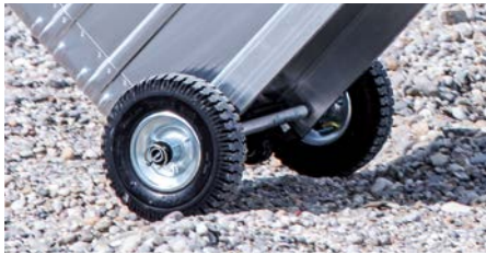
Große und geländegängige Rollen für uneingeschränkte Mobilität in unwegsamem Gelände. Offroad Set Ø 220 mm