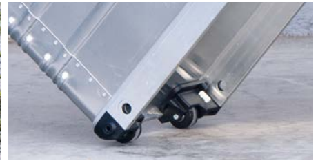
Integrierte Spezialrollen – jederzeit einsatzbereit. Ø 50 mm, serienmäßig