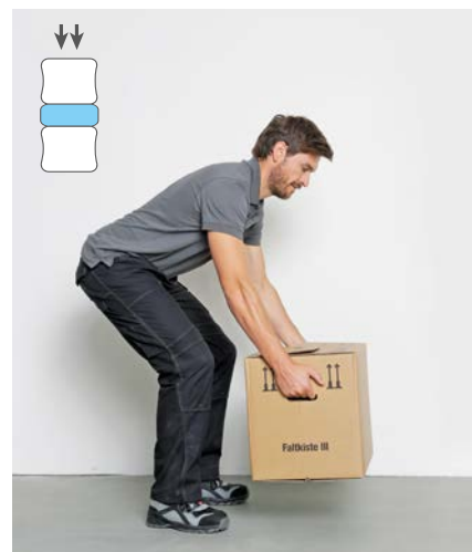
Besser: in die Hocke gehen und aus den Beinen heben